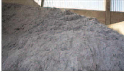
LAVADO - ESTERILIZACIÓN - ESTABILIZACIÓN