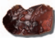
GELATINA NO ESTABILIZADA

*Tempos de mineralización verificados en ambiente controlado