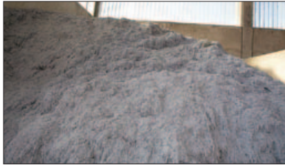
LAVAGE - STERILISATION - STABILISATION